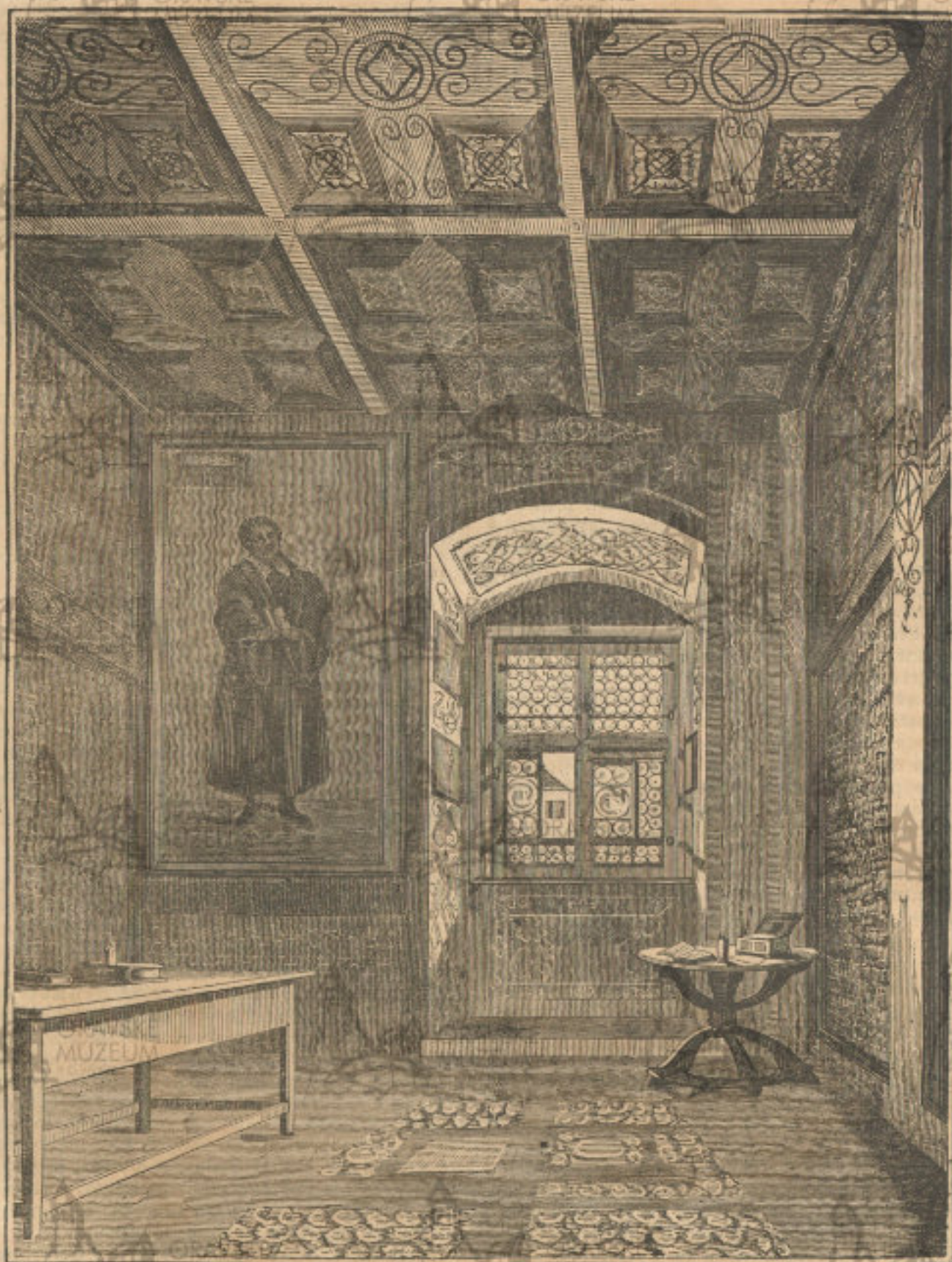
(Sele Martina Luthera w Erfurtě.)

w Erfurtě, a podrobil se všem zákonům tehole s takovou horlivostí, že i do těžké nemoci upadl, z níž ale pečej jednoho stáříského teholníka a otcov- stav lastavostí provinciala Stampice vytržen a k to- mu přiveden byl, že zotavenau sňau bohoslovijm naučau se oddal, nálež l. 1507 na kněžstwj wysvě- cen byl.